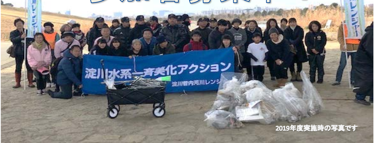
2019年度実施時の写真です