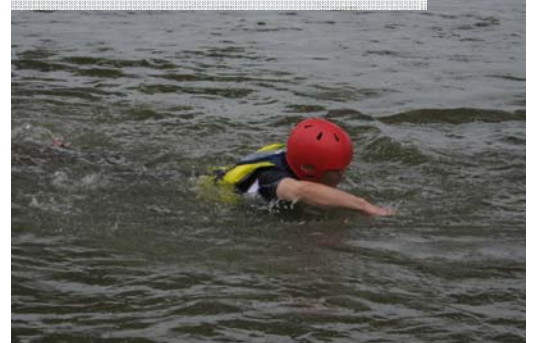
リバースイミング(積極泳法)