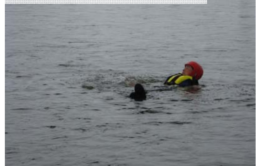
リバースイミング(防御泳法)