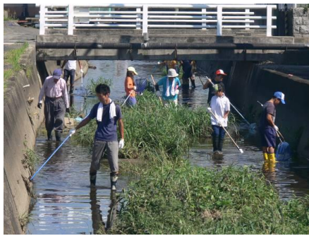
2016/9 ジャンボタニシと卵の駆除