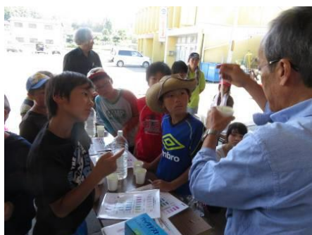
2015/9 パックテストで水質調査