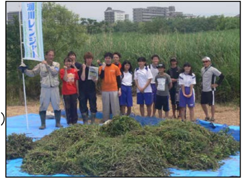
(防除した外来種前で参加者集合写真)

飲み物、筆記用具、帽子、タオル、雨具（傘など） 長袖、長ズボン、虫除け、長靴、 ゴム長手袋（水に濡れますので軍手は×）