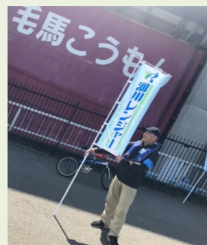
河川レンジャーの旗が目印