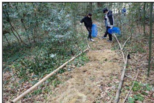
（竹林内ヒメボタル観察路造成作業）