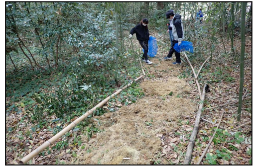
（竹林内ヒメボタル観察路造成作業）