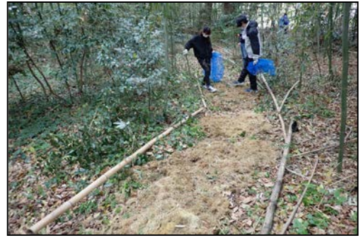
（竹林内ヒメボタル観察路造成作業）