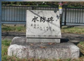
水防碑 (わざと切れ)