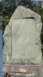
桜宮神社 澱河洪水記念碑