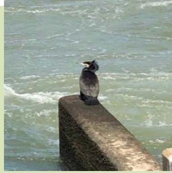
アユを狙っているカワウ