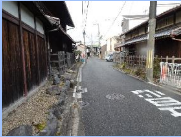
太閤堤小倉 (大和街道)