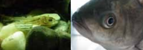
ヨドゼゼラの稚魚（木津川） ゲンゴロウブナ（大正川）