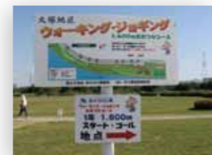
距離標（スタート地点）