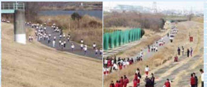
淀川河川敷にてマラソンに励む生徒・児童たち。 寒空のなかでも、河川敷がにぎわう様子がわかります。