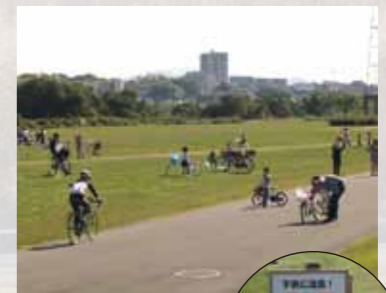
↑ 家族連れの近くを通る自転車

けて危ないと感じる事もあります。他に利用者がいるときは徐行運転をして、誰もが安全に楽しく川を利用するために、おたがいを思いやる必要があります。