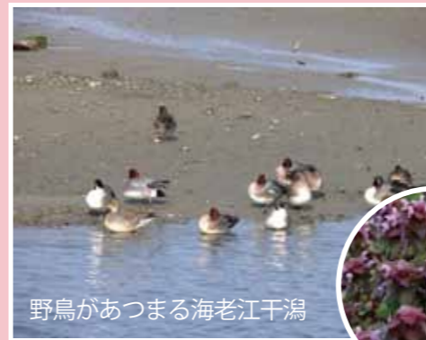
野鳥があつまる海老江干潟

住民と行政が一体となった河川管理を目指すため、淀川・宇治川・桂川・木津川をフィールドとした川に関するさまざまな活動を行い、住民のみなさんに川のファンになってもらうように呼びかけている住民と行政のコーディネーター（橋渡し役）です。