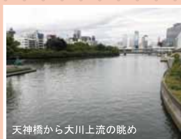
天神橋から大川上流の眺め