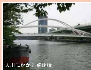
大川にかかる飛翔橋

子をする人、カメラを構える人、ジョギングやウォーキングを楽しむ人で賑わいます。私も渡りの鳥たちの飛来を心待ちにしながら、休日にはデジカメを持って出かけます。