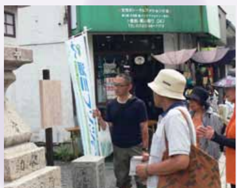
まるごと淀川講座のようす。参加者の方と共に街歩きを通して歴史や問題などを考えていきます。

淀川の「もしも」の時、私たち一人ひとりに、また、地域で出来ることは何かを考える「まるごと淀川講座」で、これから取り組んでいきたいテーマです。さあ一歩、踏み出してみませんか！私と。