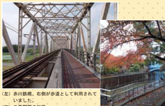
(左) 赤川鉄橋。右側が歩道として利用されてきました。 (右) 毛馬閘門の紅葉。

大阪市のHPによると、平成30年度開業予定のJR「おおさか東線」の整備により橋の歩道部分が閉鎖されます。閉鎖後は上流側にある菅原城北大橋を利用するよう呼び掛けられています。この趣のある橋を歩いて渡れるのは、あとわずかな期間です。