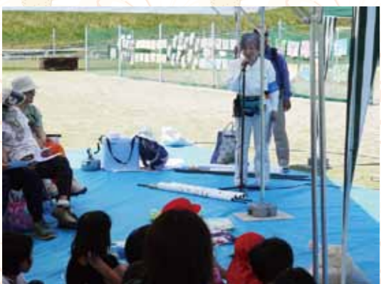
青空と緑、川のせせらぎの中で、河川敷コンサートが行われました。

そこで、私は高齢者や身障者を河川に導く活動を行うようになりましだ。多くの方達にのびやかな河川敷で川の風、香りを感じていただき、ホッとした「一刻」を楽しんでいただいています。