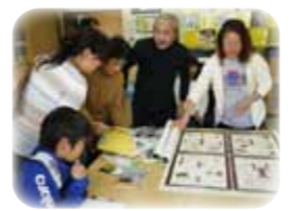
水生生物ワークショップ

水生生物ワークショップ 2月11日(火・祝) 実施場所 NPO 法人 nature works 時間 午前の部:10時～12時 午後の部:13時～15時 一般募集 午前・午後 定員各12名 水の中に棲んでいる様々な生物を描いてみましょう。教材で使用するフィールド図鑑「水に生きる生き物たち」(A5・68P フルカラー:川いい会発行)は参加していただいた方に差し上げます。