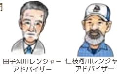
田子河川レンジャー 仁枝河川レンジャー アドバイザー アドバイザー