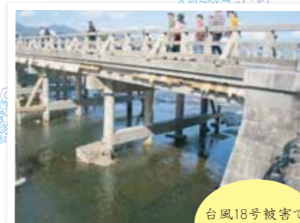
台風18号被害で一部破損した渡月橋

この観測所は、嵐山のみならず桂川の防災上必要不可欠な指標である水位を計測する重要な施設です。また、洪水時だけでなく常時水位を計測しており、インターネットで水位を見ることもできます。 九月の台風十八号では、水位標の立っている地面から最高で約八〇cmの高さまで水位が上昇し(左の写真のオレンジの点線の辺り)、周辺も浸水被害を受けました。 嵐山を訪れた際にこの水位標を見かけられましたら、観光だけでなく、ぜひ防災のことも考える一端にしてみてくださいらと思います。