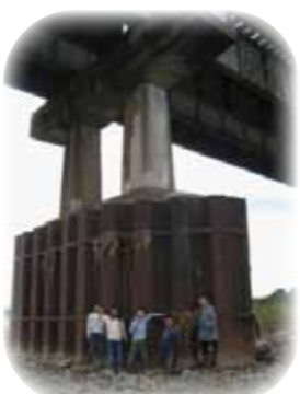
川の構造物見学会

川の構造物見学会 近鉄鉄橋と河床低下 3月16日(日) 実施場所 京田辺市近鉄鉄橋現地 時間 10時～12時 一般募集 あり 昭和初期に建設された近鉄京都線の木津川鉄橋。当時、鉄橋の所には白砂の河原の木津川水泳場がありました。現在は砂が減り川底が低くなる「河床低下」を現実に目で見て理解できる貴重な河川構造物です。約80年前からの河川環境変化を学び、一緒に将来の川作りを考えてみませんか。