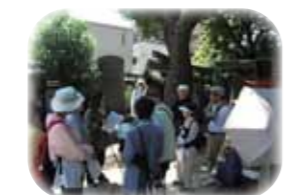
川沿い歩き歴史散歩

川沿い歩き歴史散歩 2月28日(金) 実施場所 高槻市鳥飼地区 一般募集 あり 淀川の史跡と施設見学をあわせた川沿い歩きを行います。一緒に淀川の魅力を満喫しませんか。