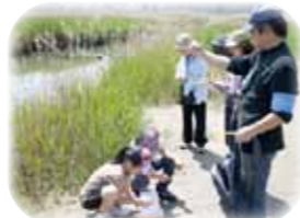
水質調査と河川敷把握

水質調査と河川敷把握 1月12日(日)、2月9日(日) 3月9日(日) 実施場所 淀川河川敷十三干潟 集合場所 西中島河川公園噴水場 時間 10時～ 一般募集 定員10名 西中島と十三干潟の水質調査と河川環境を観察します。