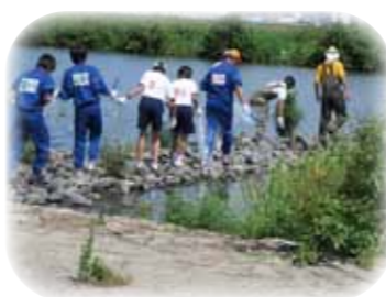
ワンドでの清掃活動

庭窪・八雲ワンド付近の活性化に ついての意見交換会 3月17日(月)～18日(火) 実施場所 守口駅前テプラザ 大阪国際学園「くすくすひろば」 一般募集 定員15名 河川レンジャー活動の紹介と親しみやすい河川敷にするための市民参加活動の意見交換の場になります。奮ってご参加下さい。