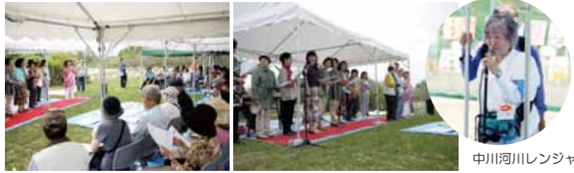
河川レンジャー活動「淀川河川敷コンサート」の様子