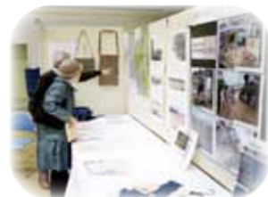
みんなで考えよう防災

淀川の歴史を学び 水害に強い街づくり 第6回 みんなで考えよう防災 1月14日(火) 時間 13時～14時30分 実施場所 淀川区・十三福祉会館 一般募集 あり 大阪は、歴史的に災害に対して非常に弱いまちであり、多くの河川氾濫による被害を受けてきました。大阪平野の成り立ち、近代以降の新淀川の開削、その後も続く水害と河川改修の歴史を知り、水害のみならず地震、高潮等の被害を出来るだけ少なくするため、地域で防災を考えましょう。