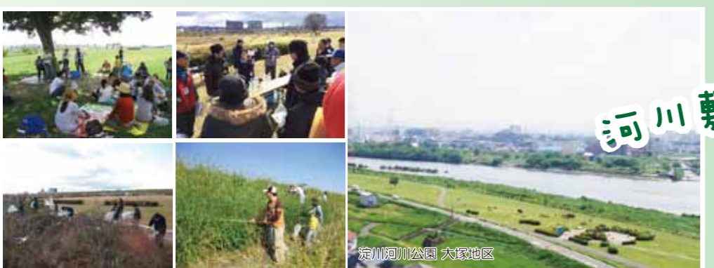
淀川河川公園 大塚地区

私が河川レンジャーになったきっかけは、淀川河川敷のすぐ横に引越して来たことです。水辺の散歩や野鳥観察を楽しむ中、ある日、大雨で川の水位が上昇しました。実際の水位を調べるため、淀川河川事務所のホームページを見た時に、河川レンジャーという存在を知りました。淀川をもっと知りたい、魅力のある川にしたいという思いで、平成二四年に河川レンジャーに応募しました。