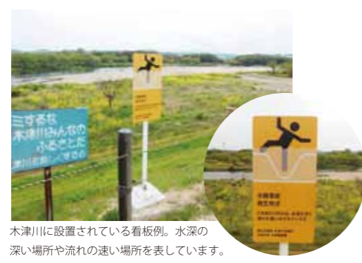
木津川に設置されている看板例。水深の深い場所や流れの速い場所を表しています。

用できるよう、さまざまな看板が設置されています。河川に近づく際は、注意喚起の看板をチェックし、また注意書きのない場所でも、ライフジャケットを着用するなど、細心の注意を払いましょう。