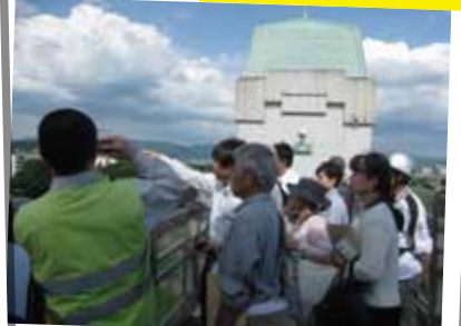
京都会場では、普段立ち入ることのできない三輪開門の展望スポットにご案内します！