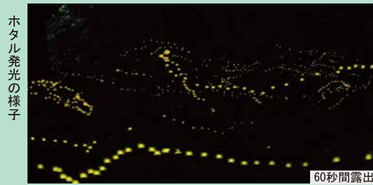
ホタル発光の様子 60秒間露出