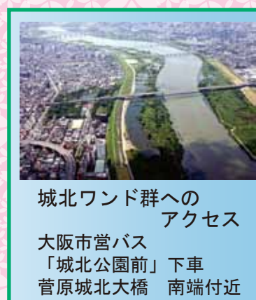
城北ワンド群へのアクセス 大阪市営バス「城北公園前」下車 菅原城北大橋 南端付近

その後も、シンポジウムなどの啓発活動や外来生物の駆除、ゴミ拾い等の環境整備などの継続した活動により、イタセンパラ復活を願う市民の皆さまの気持ちがどんどん高まってきました。また、ワンドの中を整備して環境を整えて、これまでに数回、成魚の放流を実施しています。放流後の調査結果から、世代交代(産卵→孵化→稚魚→成魚)が確認され、着実に野生復帰が進んでいると考えられています。 城北ワンド群へ行くとき、淀川水系イタセンパラ保全市民ネットワークのお知らせや環境保護に関する案内板があります。興味のある方は、ぜひ足を運んで、水の中の生き物たちがたくさんすむ場所、「城北ワンド」を見渡してください。