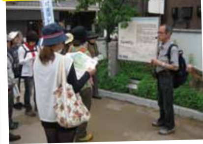
大阪会場では、かつて宿場町として栄えていた枚方の古い町並みを探訪します！