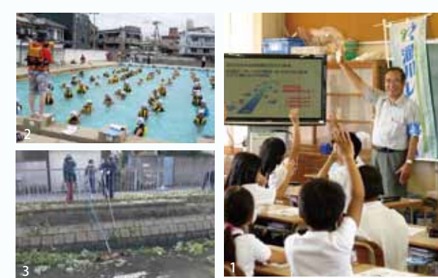
1. 小学校での淀川出前授業の様子 2. プールでのライフジャケット着用体験 3. 佐太地区の水路にて草刈りや川の中に投棄されたゴミの回収作業

私は河川レンジャーに任命されて現在2年目になります。銀行を定年退職して、自由な時間を何か社会のお役に立てることに使いたいと思い、奈良の宿坊を利用したレスパイトハウス（※難病や障害を持つお子さんとそのご家族が、ゆったりとした時間を過ごせるよう設けられた施設）のウッドデッキや花壇づくりのボランティアを行っていました。 住居を奈良から守口に移し、身近にある淀川の河川敷を利用するようになって、子どもの頃に田舎の小川で魚とりをした楽しい記憶がよみがえってきました。 そこで、淀川で何か活動できることはないかと思いインターネットを検索し、河川レンジャーへ応募しました。 淀川流域のNPOやボランティアグループと一緒に活動をしたことがなく、知り合いもいない状況でのスタートとなりましたが、少しずつ守口市役所や教育委員会、学校等の公的機関などからご支援いただけるようになりました。 私の活動では、河川レンジャーの知名度を上げるために、広報紙やケーブルテレビなどに河川レンジャー活動を取り上げていただくたり、京阪守口市駅前の「くすくす広場」で河川レンジャー活動のパネル展示などを行ったりしています。 また、子ども達に淀川の良さを伝えるために、小学校に向き「淀川のなりたちと水の大切さ」の授業や、学校のプールを利用した「ライフジャケットでの着水訓練」などの出前授業