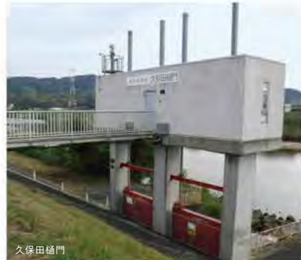
*堤内地とは、堤防によって洪水から守られている住居や農地のある土地

近年、全国各地で豪雨による被害が起きていることから、河川管理施設の役割はさらに重要性を増してきているといえます。今後「樋門」を見かけられましたら、それをきっかけに、水害ハザードマップの確認など、水害への対策についても今一度考えていただければと思います。